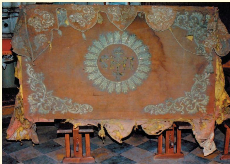
Baldachim procesyjny przed konserwacją.

Na zdjęciu obok fragment srebrnej koronki po zdjęciu z baldachimu przed i po oczyszczeniu.