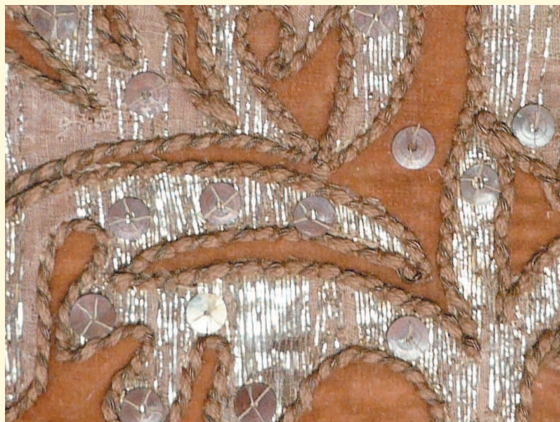
Fragment aplikacji po oczyszczeniu w trakcie prac, każda srebrna blaszka jest przytrzymywana kilkoma ściegami jedwabnej grzeży.